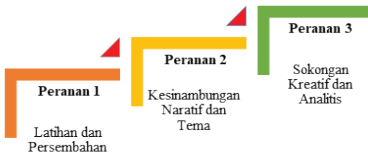
Carta 4: Tahap Peranan Dramaturg dalam Persembahan